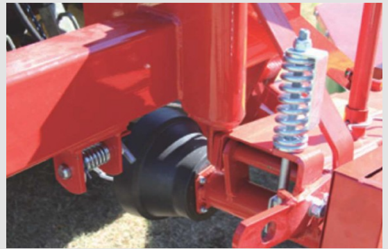
Système de tension automatique des courroies

L'entraînement par courroies permet un embrayage souple de l'outil