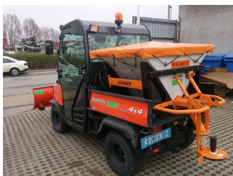
Polaro ® L 400 sur Kubota RTV