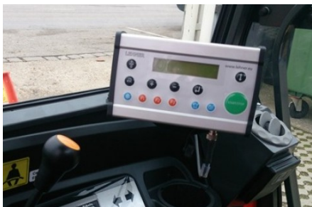
Pupitre de commande