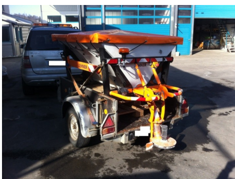
Polaro ® L 400 sur remorque