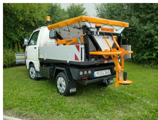
Polaro ® XL