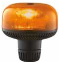
Gyrophare à LED