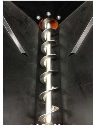
Vis sans fin

Sel purifié contenant peu d'impuretés. Sel de type chlorure de magnésium ou chlorure de calcium, utilisé comme déverglaçant. Sel utilisé pour la préparation de saumure. Température limite : -15°C pour le chlorure de magnésium et -20°C pour le chlorure de calcium