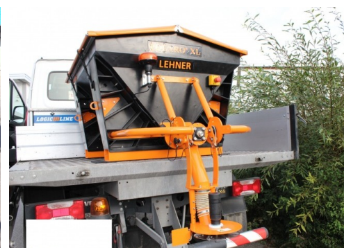
Polaro ® XL 600 sur camion

Avec les épandeurs Polaro ® X et XL , sel, sable ou gravier peuvent être épandus sans aucun équipement spécial. Les puissants moteurs 12V garantissent un fonctionnement en toutes circonstances. Stockage et maintenance aisée grâce au distributeur repliable.