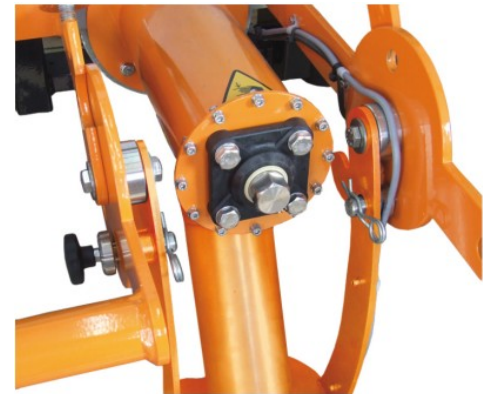
Distributeur repliable pour le stockage