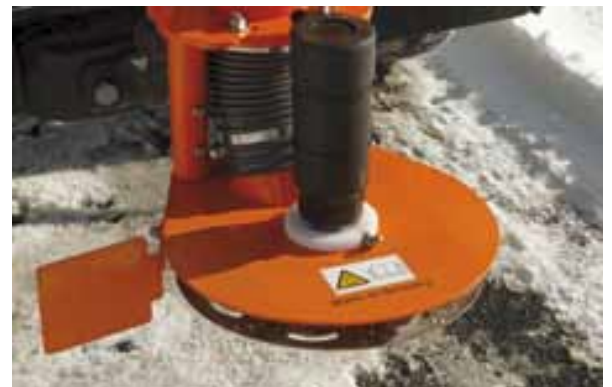
Plateau de distribution réglable en hauteur et déflecteur