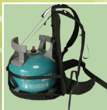
Sac à dos pour bouteille 6 kg