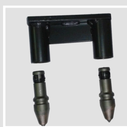
Pointes de carbure de tungstène